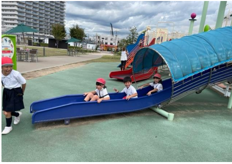
【エフピコアリーナで一休憩】

エフピコアリーナでは、気持ち良い天気のもとおいしいお弁当を頂きました。大きな遊具を駆け回りながら、元気いっぱい遊ぶこともできました。途中、迷子の小さいお子さんを心配して、一生懸命優しくなだめてくれていた様子はとても頼もしかったです、誇らしかったです。