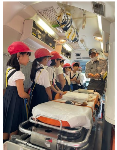
【救急車の中の様子】

市役所では、「福山市 46 万人の人々の生活を守る」ための仕事を教えていただきました。子どもたちにとっては、身近であるはずですが、よく知らなかった教育委員会と学校生活のつながりも仕事の様子を見ながら教えていただきました。展望ロビーから一望する福山市の景色は、素晴らしかったです。