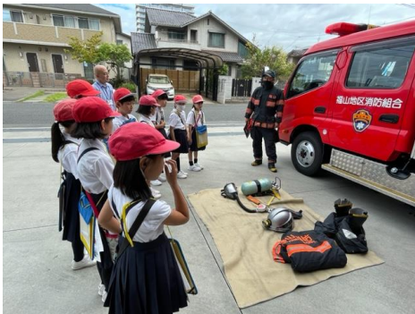
【救助時の服装の説明を受けている様子】

消防署では、火事から人々の命を守るだけでなく、火事を予防する活動についても教えていただきました。また、日々の訓練の様子や車両の設備だけでなく、救命救助のために建物自体も工夫されていることなど貴重なところを見せていただきました。