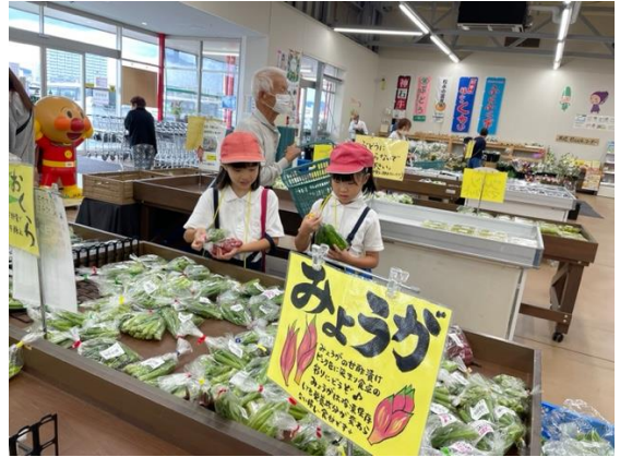
【新鮮な野菜を吟味している様子】

最後の見学場所の FUKUYAMA ふうふう市では、福山の特産や生産者さんとお店のつながりを知り質問をたくさんしていました。楽しみにしていたお買い物も、吟味に吟味を重ね、真剣に代金を計算しながら買うものを決めていました。